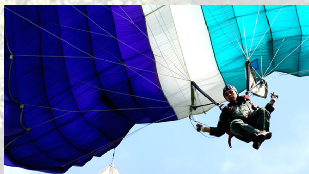
圖六、世運比賽項目飛行運動

在比賽時須搭乘飛機上升到數千至上萬英尺的高空，然後利用跳出機艙到開傘之間的自由落體時間，做出各式各樣的花式動作，以此來一較高下。至於近幾年比較流行的「指定花式」、「隨機花式」等比賽，因為需要多一點自由落體時間來做指定動作，所以起跳高度大多在 1 萬 3000 英尺左右，在開傘前大約有 45 秒的時間，讓選手做各種指定或隨機抽樣的動作，每隊必須配置一個空中攝影隊員，將選手的表現完整拍攝下來，然後由裁判群根據各隊表現的動作難度、流暢度等來評分。