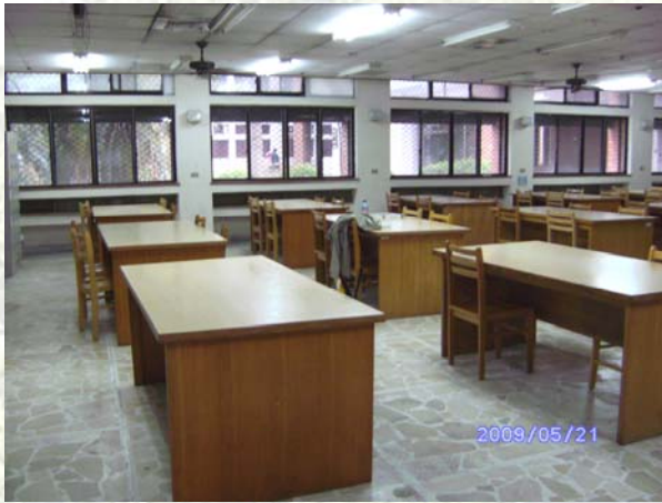
圖一、整齊清潔的系 K