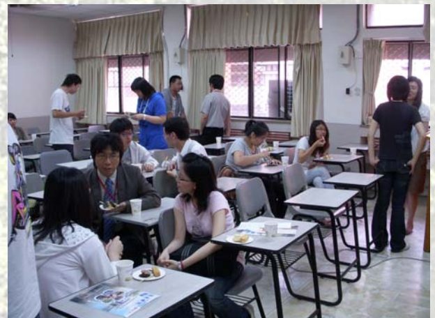
圖三、茶會實況(學長姐們努力爲學弟妹解答)

本次茶會給予了許多尚未找到師門的新生很大的幫助，也協助了已經找到師門的新生跟自己未來的直屬學長姐交流認識。唯首次於學期中辦理迎新，許多尚有不足的地方，幹部這邊將會如實記載與檢討，期望下屆聯合迎新茶會能更臻完美。