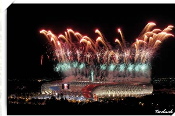
圖五、520 世運主場館落成音樂會煙火

再過不到一個月就是漫長的暑假了，你是否已經規劃好各式各樣的活動？當然我想旅遊也是選項之一吧！今年暑假七月十六日，台灣四百年歷史上空前的體育盛會—2009 世界運動會，將在高雄舉辦。屆時將有近一百國，五千位的選手參與盛會，除此之外，高雄也為這次世界運動會規畫許多新穎的場館，其中最具有代表性的就是「龍騰世運主場館」以及「漢神巨蛋綜合體育館」，如果能夠蒞臨盛會，我想這不僅是體驗緊張刺激賽事的難得機會，場館的建築設計更能帶給你全新的視覺饗宴。