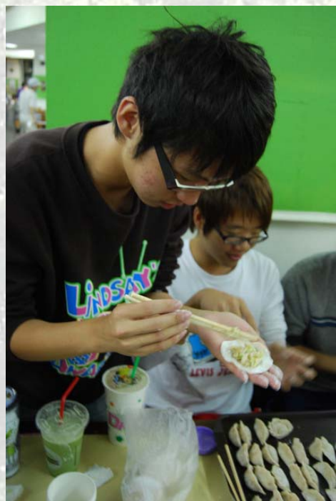
99級的小老爹學長爲了他的晚餐，非常努力地包水餃

組別接的超有創意，然後有的組別分數會笑死人，都快要被評審搞死了。活動的尾聲就輪到了系會的抽獎，獎品真的很有創意，有時候佩上得獎人更會讓人會心一笑，似乎有一種命中注定的感覺。其實這種活動就大家聚在一起就會很開心，也不需要有什麼特別安排，畢竟我們工資管可是很有人情味的一個大家庭，Y E S，湯圓會圓滿落幕囉！