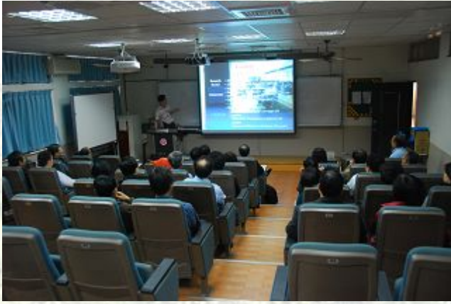
68 級學長姐在 61102 聽簡報(二)