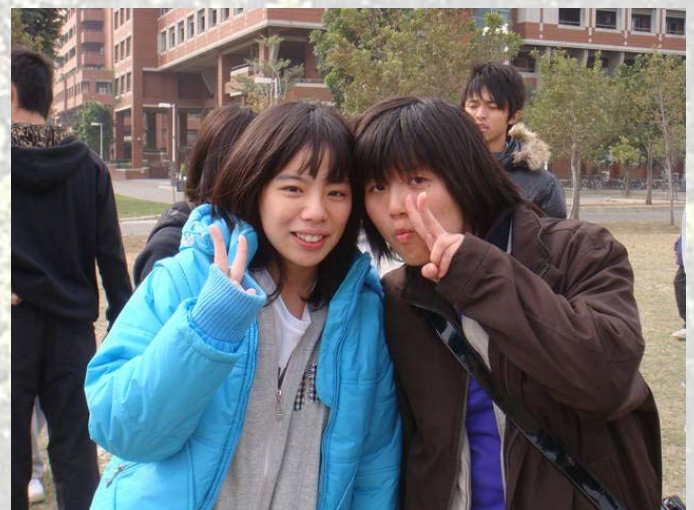
謝謝大家的熱情支持，這學期的系砂鍋就在這邊告一段落啦，相信在體幹股的用心之下，歡樂的壘球系砂鍋一定可以爲大家在這學期畫下完美的句點。