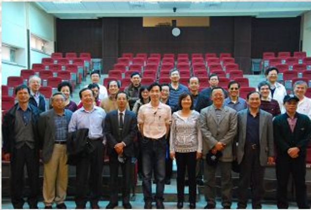
68 級學長姐在階梯講堂合照