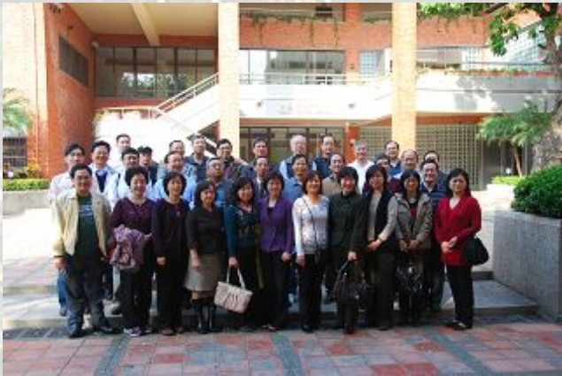
68 級學長姐在系館外合照