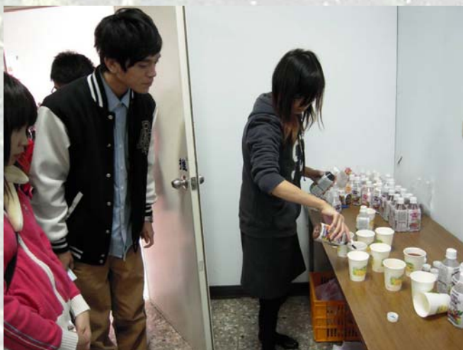
蔬果汁的試飲，有紅的、黃的、紫的三種蔬果顏色