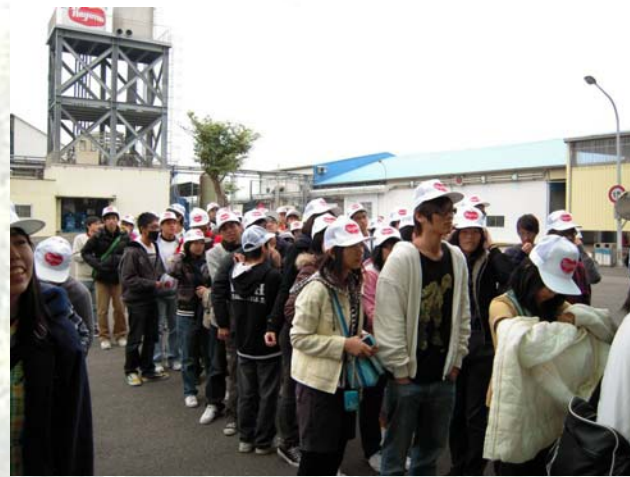
集合準備要去參觀生產線囉!