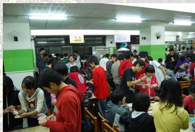
將近 100 人參與的湯圓會，熱鬧非凡