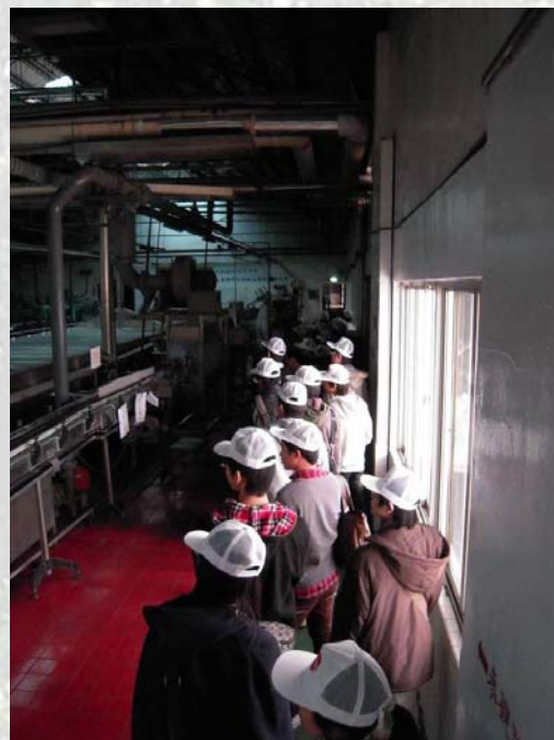
生產線的參觀和解說