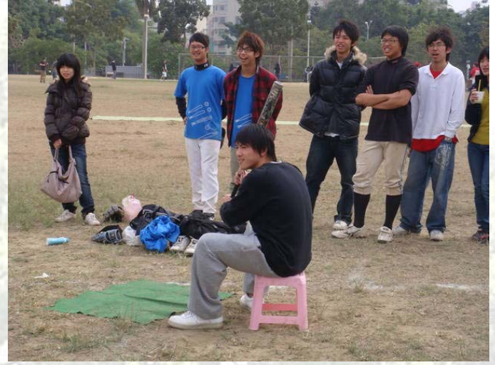
101 級的阿國，以及他的新式打法~~~~