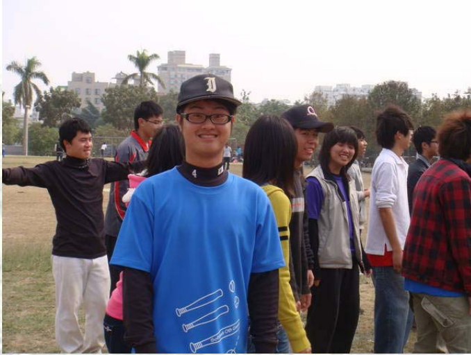
樓上是 101 級的王牌投手謎謎，在這次的系砂鍋中扮演著不可或缺的角色 XD