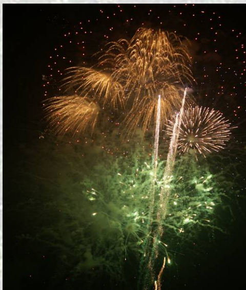
煙火還有顏色的變換

看完煙火之後我們就心滿意足的踏上歸程啦，不過不要以為元宵節的活動就這麼結束了，還有超強元宵活動第二彈在等著我們呢！