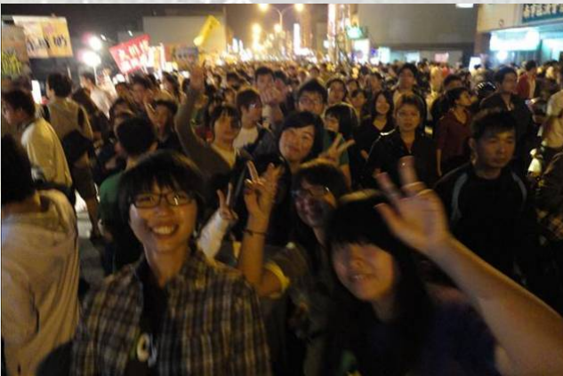
現場非常非常多人

鹿耳門聖母廟每年都會固定在元宵節這天施放蜂炮跟高空煙火，現場人山人海，擠得水洩不通。