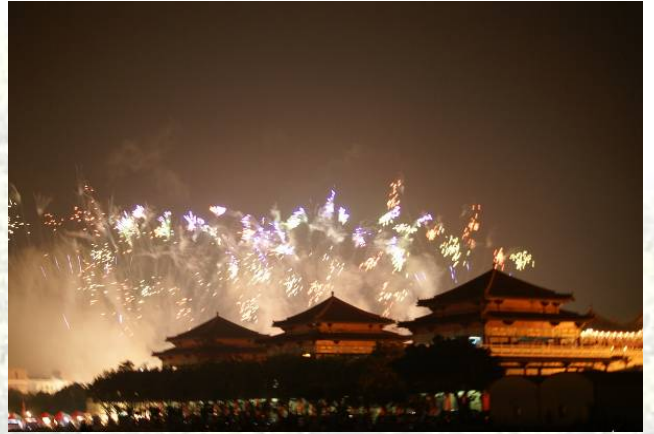
煙火從廟上方射出來

首先是開幕煙火，煙火從廟上方咻咻咻的射出來，壯觀又漂亮，大家都看的目不轉睛，不過接下來才是重頭戲呢。